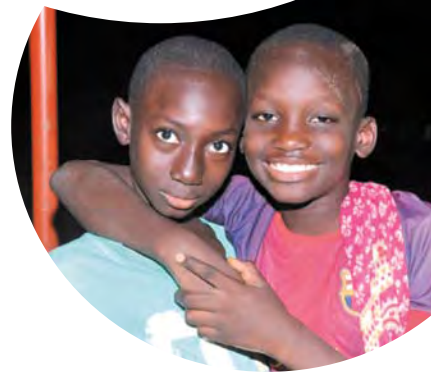
Deux jeunes écoliers sénégalais le jour de la distribution.

La cérémonie officielle de cette 13 e rentrée solidaire s'est déroulée dans une banlieue défavorisée de Dakar, à l'école Terme Sud de Ouakam. La directrice de l'école, avec les membres du CNDREAO, a mis les petits plats dans les grands pour que cette journée soit réussie. Et elle le fut !