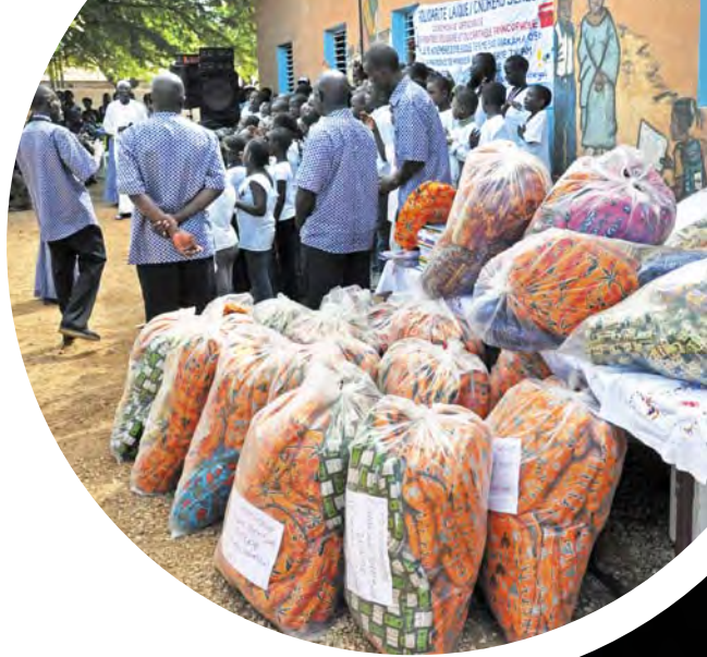
Différents lots des fournitures récoltées avant la distribution.