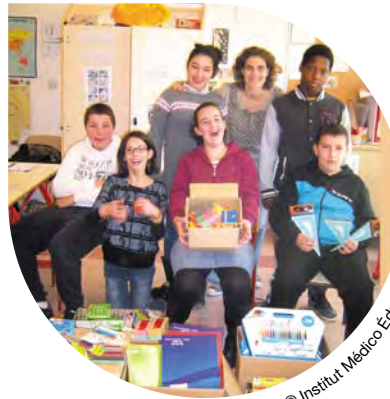
© Institut Médico Éducatif Paul Soulié (82)