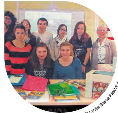
© Lycée Blaise Pascal de Ségre (49)