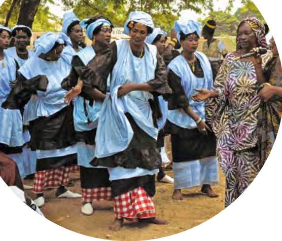
Ouakam (Sénégal) - Femmes réalisant des danses traditionnelles le jour de la distribution.