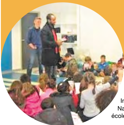
Intervention de deux membres du Conseil National des Jeunes Guinéens de France dans une école élémentaire à Mauzac (31).