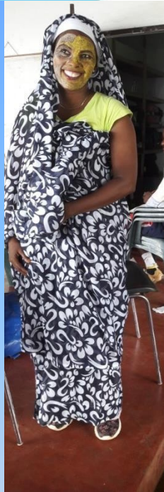
Les tenues vestimentaires des mahoraises