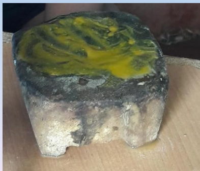
Le masque de beauté