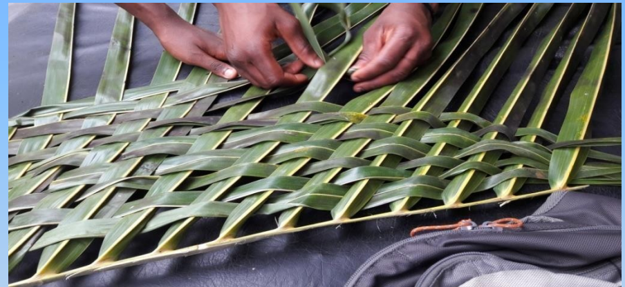
Le tissage de coco