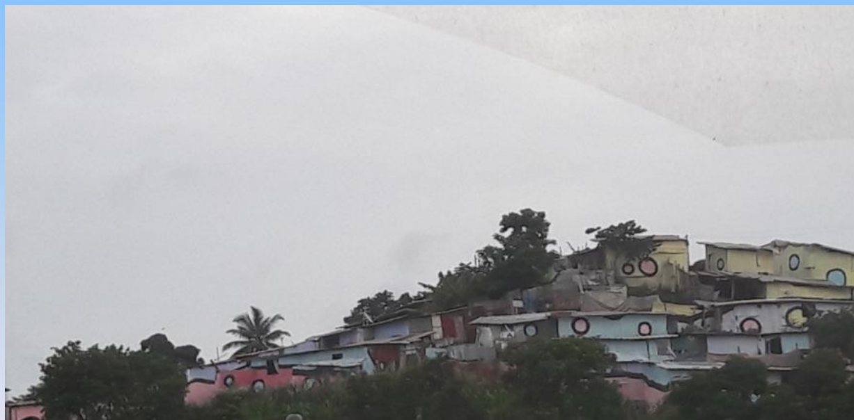
Disparité des habitations