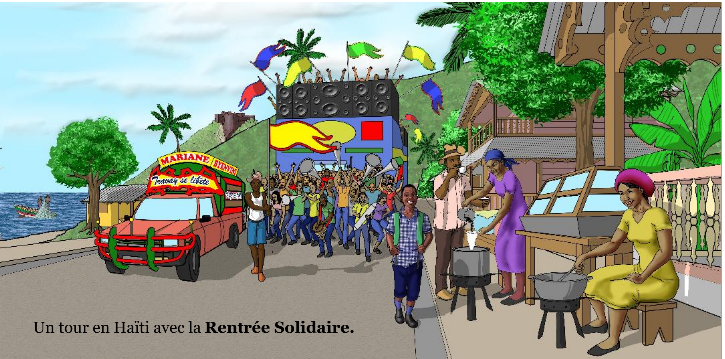
Un tour en Haïti avec la Rentrée Solidaire .

Inscrivez-vous à notre newsletter en envoyant « NEWSLETTER » en objet à sjeanbaptiste@solidarite-laique.org