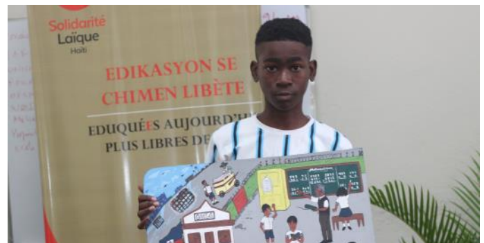
Un participant au concours présentant son œuvre

Par ailleurs, l'institution a organisé la première édition du concours de peinture « Enspirasyon Edikasyon » (Inspiration : Education) pour des