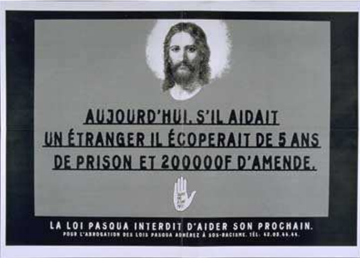
Affiche SOS Racisme

Ainsi, le racisme et la discrimination s'expriment principalement à partir de ces présupposés partagés, reposant bien souvent sur des argumentaires qui s'avèrent faux, fallacieux ou irrationnels. Mais ce sont des phénomènes complexes qu'il faut absolument appréhender à plusieurs échelles et à plusieurs degrés. Si l'on s'en tient au seul vingtième siècle, le rejet, fondé sur des préjugés raciaux a pu prendre la forme extrême de génocide. Des sociétés entières, aveuglées par les systèmes de propagande reposant sur une information massivement diffusée, ont pu basculer dans le racisme de masse : En 1915, les Arméniens de l'Empire Ottoman ont été victimes d'un racisme qui a abouti à une extermination programmée de cette minorité chrétienne en terre d'Islam. Entre 1941 et 1944, les Juifs d'Europe ont subi un sort aux formes sensiblement identiques mais de plus grande amplitude sous l'impulsion de l'État nazi. Plus récemment, au Rwanda en 1994 ou en Bosnie-Herzégovine en 1994-95, des massacres ont révélé que le racisme de masse pouvait encore exister à la fin du XX ème siècle.